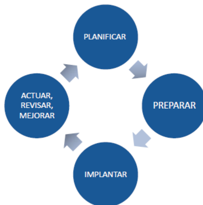
Figura 3: Proceso de compromiso de los grupos de interés

Tras establecer el propósito, el alcance y los grupos de interés para el compromiso, los propietarios del compromiso necesitan asegurar que se implanta un proceso de compromiso de los grupos de interés de calidad. El proceso descrito en la norma AA1000SES (2011) consta de cuatro etapas: Planificar; Preparar; Implementar; y Actuar, Revisar y Mejorar.